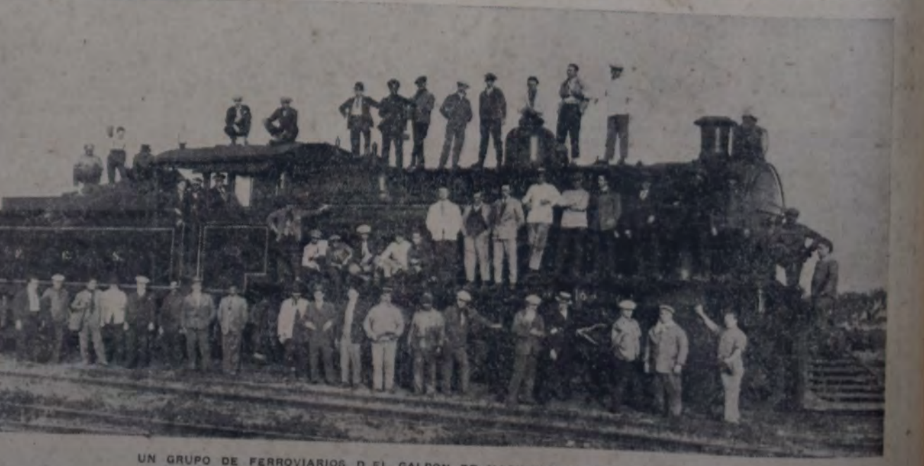
UN GRUPO DE FERROVIARIOS DEL GALPON DE MAQUINAS DE LAS FLORES.

Reproducimos esta vista fotográfica de una parte del personal de uno de los turnos que trabaja en el galpon de máquinas de Las Flores.