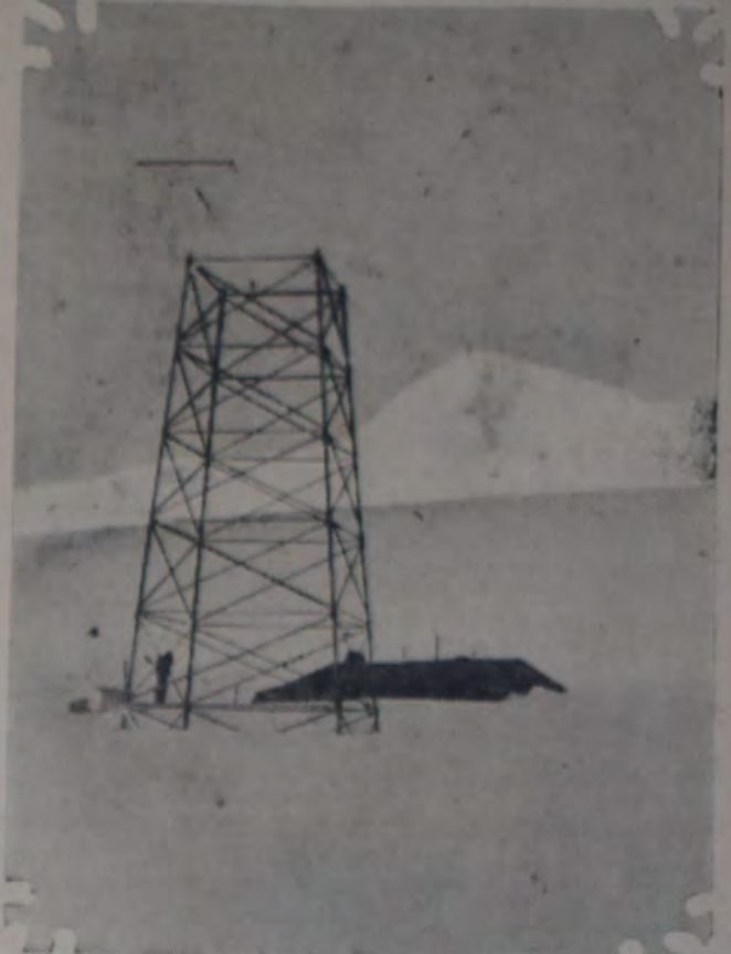
LA ANTENA DE LA ESTACION RADIOTELEGRAFICA DE LA ISLA