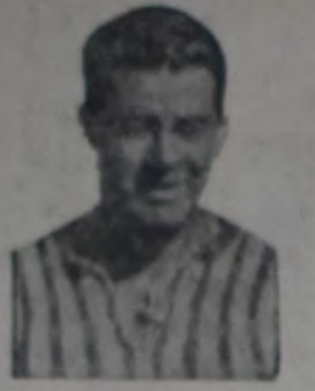
QUE CONVIRTIO UN PENAL EN GOL DEL PARTIDO DE AYER JUGADO EN BARCELONA, ACREDITANDO AL PRIMER TIO DE LA FERIA SPORTIVO BARRACAS.

Hoy, máxima tensión en cuanto a responsabilidad del debut. No menos de nueve mil personas se citaron al estadio de hoy, para la prueba que empezó contra el equipo del interesante equipo.