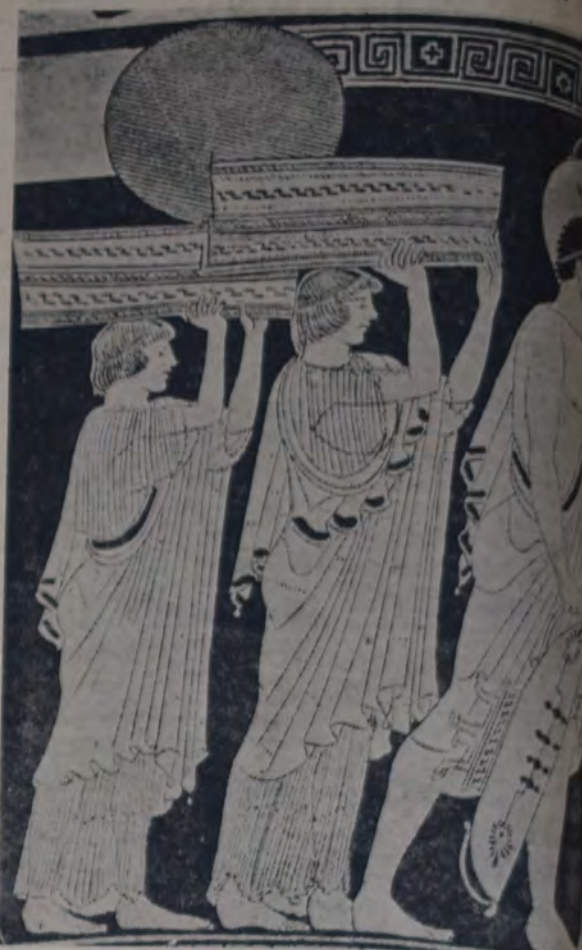
COBRA GRAN VALOR LA FAMOSA FRASE DEL ECLESIASTES... frente a las figuras representadas en este fragmento de vaso del año 400 antes de nuestra era, donde se observa que la famosa moda de la melena a la "garçonne" estaba en pleno auge, y ¿por qué no también el cubito y el charlotton?

(Número 4 — Continuación) —Por lo pronto no más te ponzo esta resta en el gaznate... (Mi qué rochoncito y qué blanco lo tienes!...)