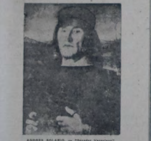
ANDRES SOLARIO. — "Senador Vasceleno"