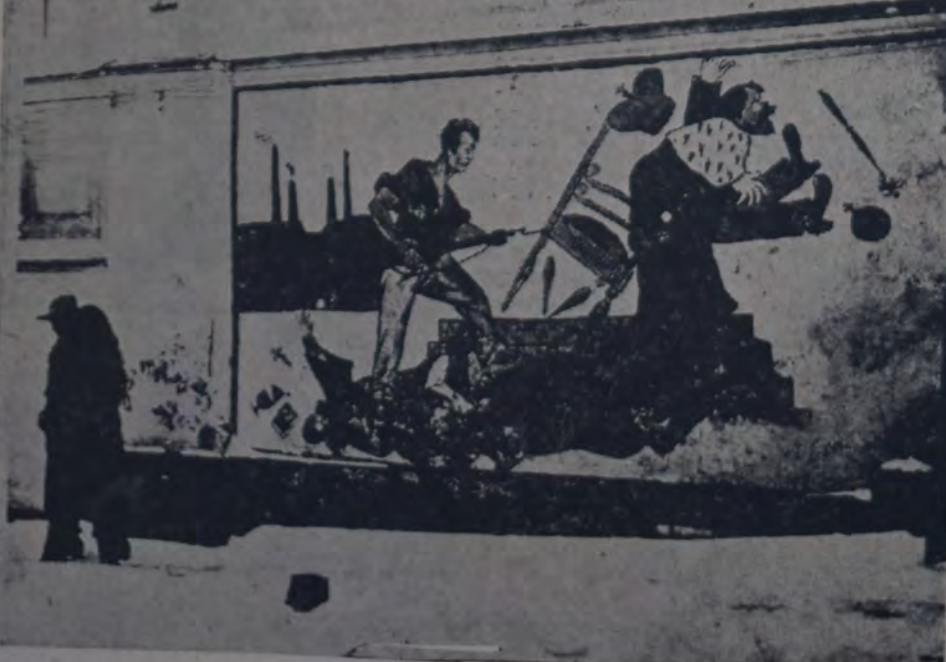
ES INDOUBABLE QUE AUN HAY MUCHO QUE HACER EN RUSIA PARA QUE LA MASA POPULAR AQUÍ. late la importancia del cambio producido. Frente a un gran masa analfabeta, allí donde no puede llegar el libro, la escuela o la palabra, la propaganda gráfica expresiva y simple cumple su misión. — Una pared aprovechada en ese sentido, la figura mural representa al pueblo ruso en el acto de desalojar del trono al ex zar Nicolás II