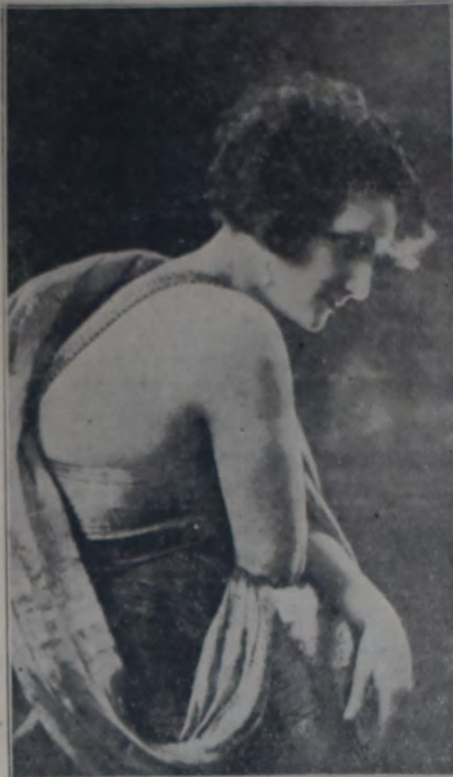
LA EXCELENTE ACTRIZ IRENE LOPEZ HEREDIA, QUIEN, AL FRETE DE SU COMPANIA, TORNARA A VISITARNOS ESTE AÑO, DEBUTANDO EN EL ODEON A FINES DEL MES DE ABRIL