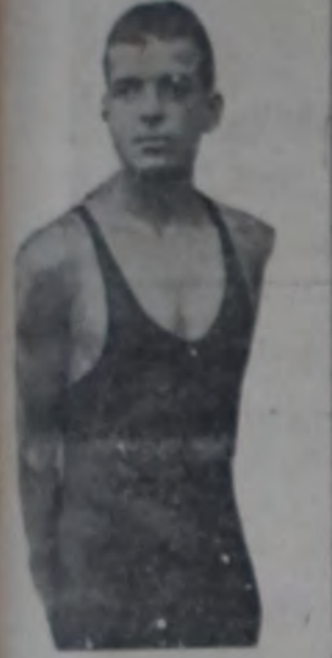
ALBERTO ZORRILLA, EL CAMPEÓN SIMPLICI, QUE INTERVIENE EN LAS PRUEBAS DE 100 Y 400 METROS ESTILO LIBRE, Y 100 METROS, ESTILO ESPAÑA.

Retiro Athletic Club — Comunica que en oportunidad remite la memoria y balance de la temporada de 1928.